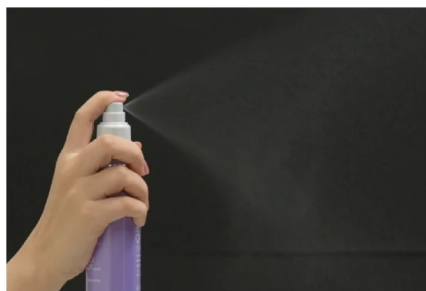
高圧乳化技術を採用