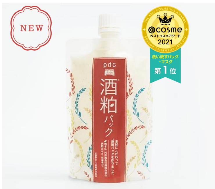
ワフードメイド 酒粕パック

酒粕＝酒粕エキス(保湿成分)配合 ※1 古い角質 ※2 ワフードメイド SKパック Nと比較して