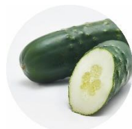
キュウリ果実エキス