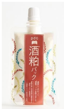
酒粕パック トライアルミニ

酒粕パックがそのまま小さく！通常サイズ購入前のお試 しや、ご旅行などの持ち運び用としてご活用ください。