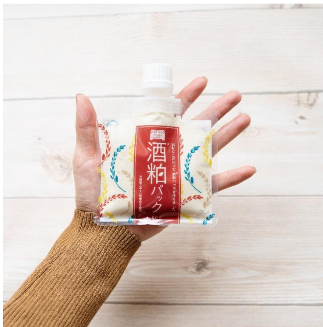
ワフードメイド 酒粕パック トライアルミニ