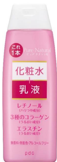
ピュア ナチュラル エッセンスローション リフト 210mL