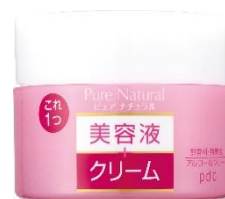
ピュア ナチュラル クリーム モイストリフト 100 g