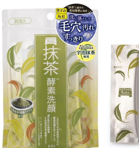
ワフードメイド 宇治抹茶※1酵素※2洗顔 30包