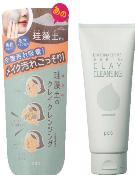
リフターナ 珪藻土※1クレイクレンジング