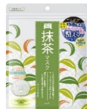
ワフードメイド 宇治抹茶※1マスク 10枚入 650円(税抜)