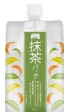
ワフードメイド 宇治抹茶※1パック 170g 1,200円(税抜)