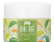
ワフードメイド 宇治抹茶※1オールインワンジェル 100g 1,200円(税抜)