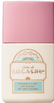
ボカシュ ダブルキープベース コーラル 希望小売価格 1,400円(税抜)

「ボカシュ」は、20代後半～30代前半の自然な仕上がりを好む女性へ向けたブランドです。肌のくすみ・乾燥しわ・テカリ等を厚塗りで隠すのではなく、肌にぼかしフィルターをかけたように、素肌の良さを活かした雰囲気のある肌に仕上げてくれます。