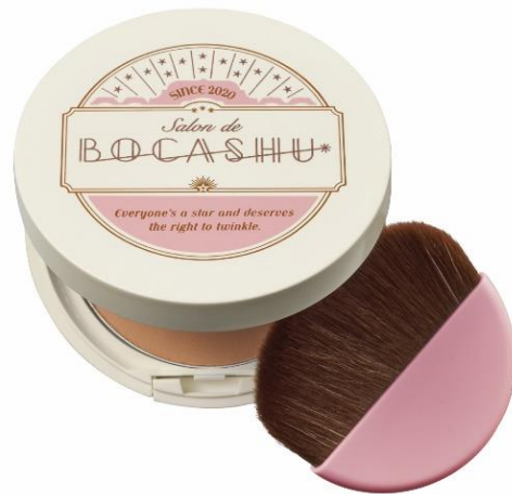
ボカシュ ブラーパクト 全2色 ライトベージュ/ナチュラルベージュ 希望小売価格 1,800円(税抜)