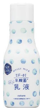
とろ〜り乳液 RN 200mL 1,200円 (税抜)