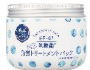
角質トリートメントパック 170g 1,200円 (税抜)