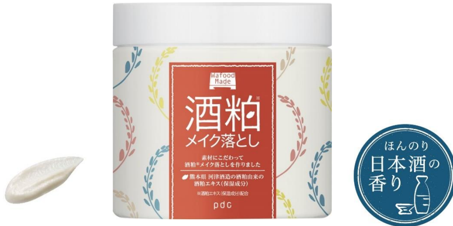
ワフードメイド SKメイク落とし