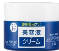
ピュア ナチュラル