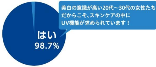
自社調べ (20～30代女性 N=293)