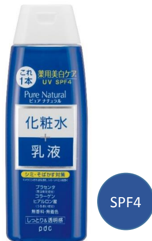
ピュア ナチュラル

「ピュア ナチュラル」は、1992年発売以来、働く忙しい女性を中心に、簡単・手軽なスキンケアとして、愛され続けてきました。シリーズ累計出荷数も、7,900万個突破しているセルフスキンケア市場でもロングセラーブランドです。これまで同様、使用感の手軽さはそのままに、美白ケアにはうれしい日差しケアができるSPF機能付き(ローションのみ)で、美白有効成分プラセンタを配合し、価格もベーシックラインやリフトラインと同じ価格にして、よりお買い得な価格になっています。