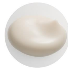
ワフードメイド とうふ洗顔