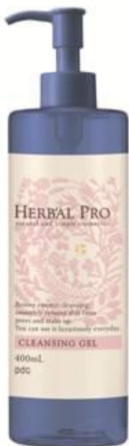
『ハーバルプロ マイルドクレンジング』 (400mL)

今回、発売する『ハーバルプロ マイルドクレンジング』は、植物由来の洗浄成分を含んだジェルに、7種のオーガニックハーブを配合したオイルフリーの美容液クレンジングジェル。うるおいを残しながら、肌に負担をかけずにメイクや毛穴の汚れをしっかりと落とします。毎日たっぷり使える大容量400mL。