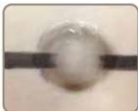
ウォータープルーフのアイライナーにも使えます。