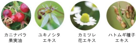
カニナバラ果実油