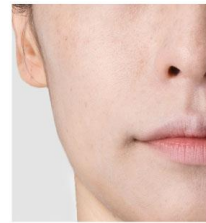
オイルコントロールベース N