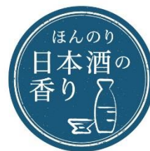
ワフードメイド 酒粕マスク