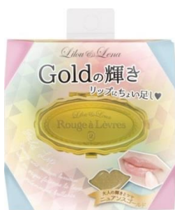
リルレナ ビジューリップ 【ニュアンスゴールド】 <美容液リップグロス・アイカラー>