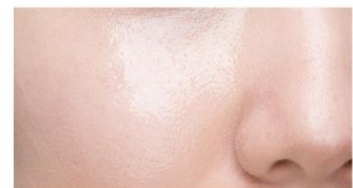
ファンデポリューマーを ちょい足し