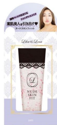
リルレナ ヌードスキンフィット <ジェル状化粧下地>