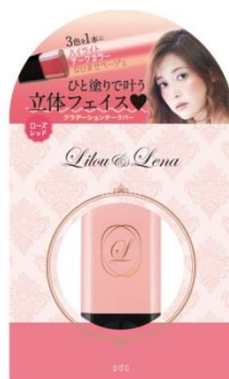
リルレナ グラデーションチークバー R <チークカラー・リップカラー・フェイスカラー>