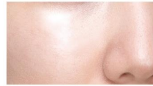
ライティングイルミネイターを ちょい足し