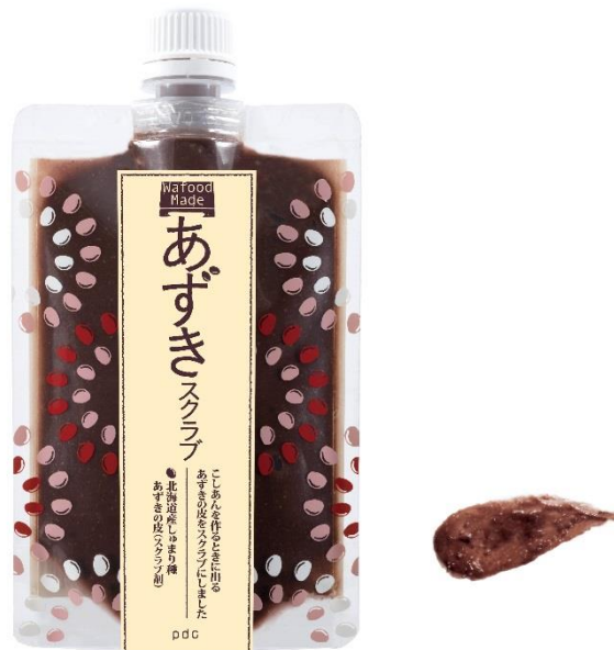
ワフードメイド あずきスクラブ

古くから日本では食材を美容素材として使う、知恵袋的な美容法が根づいています。そんな日本ならではの考え方を活かし、現代風に使いやすくし、効果感を感じやすくしたブランドが「Wafood Made（ワフードメイド）」です。『あずきスクラブ』は、北海道産しゅまり種のアズキを使用したスクラブで、30代から40代の悩みであるお肌のザラつき・ゴワつきにアプローチするやさしい使い心地のスクラブです。日本古来の素材に着目し、『美味しいを美しく』を新提案する「Wafood Made（ワフードメイド）」で、スキンケア市場の更なる活性化に貢献してまいります。